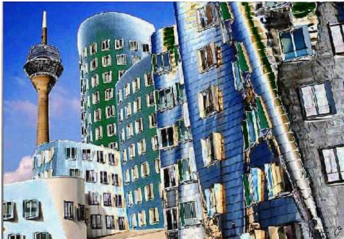
„Düsseldorf-silver“ Photopainting in C-Print auf Leinwand/Keilrahmen 100 x 80 cm 140 Euro (unlimitiert)

Das so genannte Photopainting hat in den vergangenen Jahren immer mehr Interessenten gewonnen.